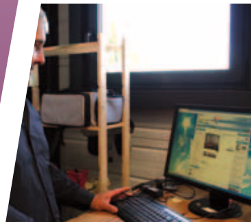
La Bourse des affaires

Le dynamisme de nos zones d'activités se traduit par de nouvelles actualités.