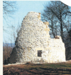
Le Moulin Fondu

Du haut de ses 150 m, le Mont Ganelon domine les communes de Janville, Clairoix, Bienville, Coudun et Longueil-Annel.