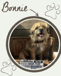
Bonnie de LA FAMILLE BÉLIER et de L'ÉCOLE BUISSONNIÈRE

assistera aux spectacles de rapaces avec des buses, aigles, vautours, cigognes et perroquets qui frôleront la tête des spectateurs... En 2016, les spectateurs avaient frissonné devant ces grands animaux qui déployaient leurs ailes majestueuses et obéissaient au doigt et à l'œil de leurs dresseurs.