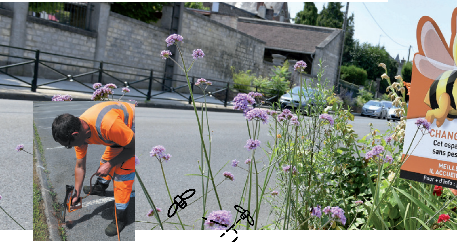
► La technique du désherbage thermique est maintenant utilisée

Pour avoir des espaces plus sains pour notre santé, les méthodes écologiques de jardinage induisent la présence d'herbes plus hautes et de plantes sauvages. Nous vous expliquons pourquoi.