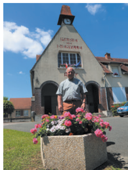
Bienville a fait l'acquisition de nouveaux bacs à fleurs

“On utilise ce fonds pour beaucoup de petites choses, nous prévoyons de financer ainsi 13 opérations en 2018. Cela participe à nos investissements pour répondre aux réglementations (accès aux personnes à mobilité réduite, charte zéro produits phytosanitaires), mais cela participe aussi à l'achat des équipements plus classiques comme des bacs à fleurs, des bancs, des poubelles ou des panneaux directionnels. Il y a deux ans, nous avons un projet plus important, avec la réalisation d'une aire de jeux. Sans les aides de l'ARC et du Conseil départemental on ne ferait pas les mêmes investissements. J'apprécie aussi la souplesse des fonds, on peut proposer des actions dans le courant de l'année. Cela permet de financer