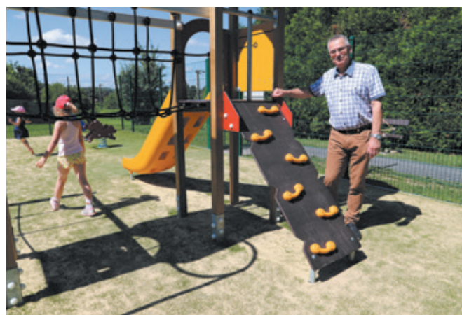
La nouvelle aire de jeux à Janville

Le versement du fonds de concours n'est pas automatique, il doit correspondre à des opérations ciblées justifiées sur facture par les communes. En 2017, entre 1 et 14 actions ont été présentées selon les communes, sur des sujets aussi divers que la réfection de voirie, la vidéo-protection ou la sonorisation d'une salle des fêtes. Dans la majorité des cas, le cumul des actions proposées et les subventions accordées atteignent le plafond de 30 000 € par commune.