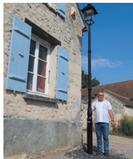
À Néry, les réseaux du hameau du Huleux ont été enfouis.

“Les 30.000 € de l'ARC correspondent à ¼ de nos investissements 2017. Ils ont financé des opérations déjà programmées et nous permettent de garder de l'argent pour un gros investissement d'enfouissement de réseaux en 2018. Dans la Communauté de Communes de la Basse Automne nous n'avions pas ces fonds de concours. Nous avons découvert leur existence lors de la fusion et ce fut une bonne surprise, surtout en cette période de baisse des dotations de l'État. Par rapport aux autres subventions, celles de l'ARC ont l'avantage d'être plus souples sur le type d'opérations, sur les dates et sur les montants puisqu'elles concernent