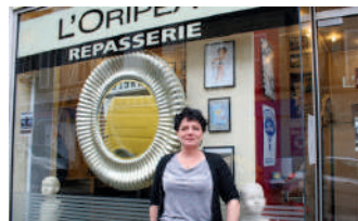
L'Oripeau - Repasserie 9 rue des Boucheries