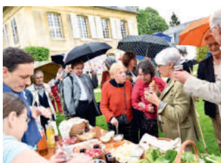
◀ La traditionnelle "garden-party" de l'association des Avenues de Compiègne s'est cette année déroulée sur les pelouses du Haras.

Quartier du Camp de Royallieu ▶ L'inauguration de la nouvelle salle municipale a attiré de nombreux habitants du quartier venus découvrir ce nouvel équipement.