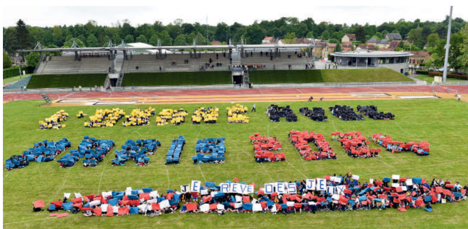
2024 sportifs de l'ARC se sont rassemblés au stade Paul Petitpoisson pour afficher leur soutien à l'organisation des J.O. de 2024 à Paris.