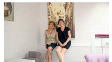
Comme Avant - Restauration traditionnelle et familiale 3 rue du Port à Bateaux