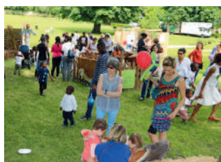
◀ La Fête des crèches a réuni enfants, nounous et parents dans le Parc de Bayser.

Les Capucinaides ▶ ont eu beaucoup de succès malgré une météo peu favorable.