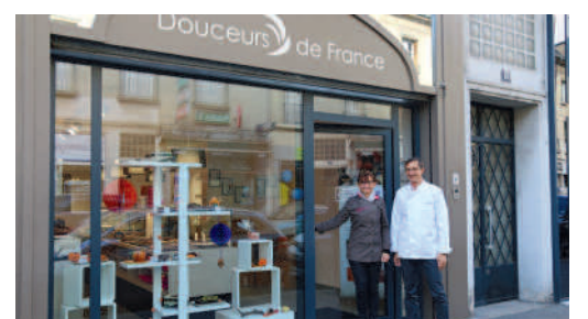
Douceurs de France - Chocolats, Caramels, Pâtes de fruits 20 rue Solferino