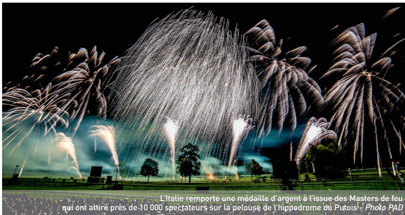
L'Italie remporte une médaille d'argent à l'issue des Masters de feu qui ont attiré près de 10 000 spectateurs sur la pelouse de l'hippodrome du Putois