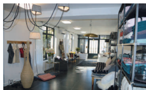
Juste un peu - Conseils et objets de décoration 17 rue Fournier Sarlovèze