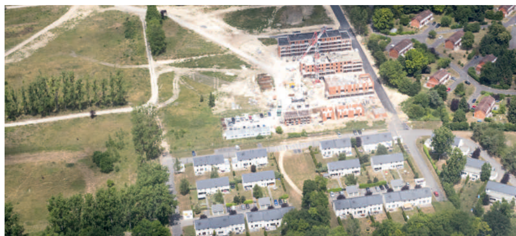
Construction en cours du "Clos de la Forêt" par l'OPAC de l'Oise.

Des pistes cyclables seront par ailleurs créées pour rejoindre et traverser ce nouveau quartier de Compiègne. ■