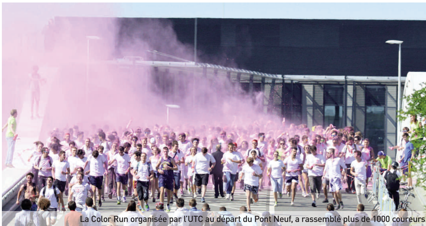
La Color Run organisée par l'UTC au départ du Pont Neuf, a rassemblé plus de 1000 coureurs.