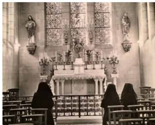
Chapelle de la Compassion

Douzième épisode du journal d'Adrienne Deforges.