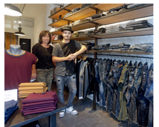
Le Factory - Prêt à porter hommes et femmes 33 rue Saint-Corneille