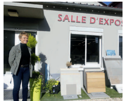
Prizzon carrelages 43 rue Saint-Lazare