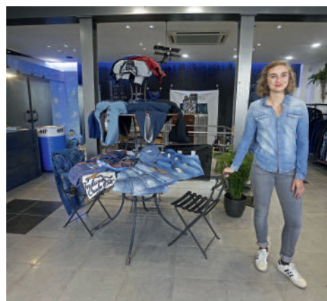
Bleu de Gènes 28 rue des Lombards