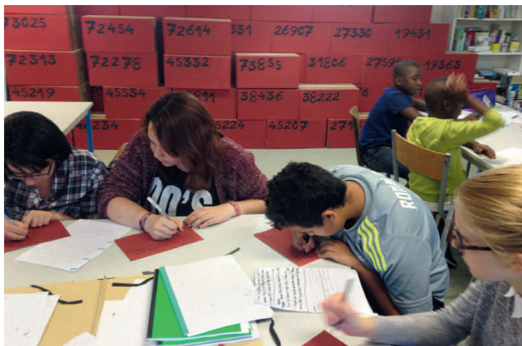
Après avoir recherché les matricules de déportés passés par le camp de Royallieu de Compiègne, les jeunes adolescents se sont ensuite mis en quête de trouver leur parcours. Ils ont ainsi appris sur quelles missions ces hommes et ces femmes étaient affectés, la durée de leur emprisonnement, comment avait pris fin leur calvaire.

L'équipe du service animation de la Ville de Compiègne s'est mobilisée autour d'un travail de sensibilisation des jeunes des quartiers de la politique de la ville au "devoir de mémoire".