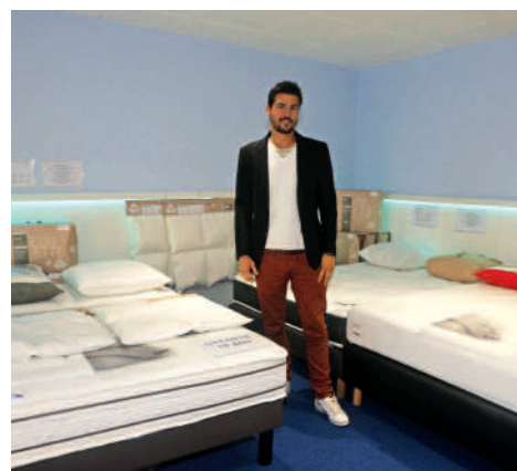
Literie Logis - Matelas, sommiers... 23 cours Guynemer