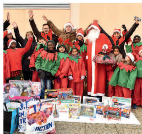
Les lutins passeront le 9 décembre dans les rues de Compiègne pour la collecte des jouets.

Les Compiégnois qui souhaitent bénéficier de l'opération Noël Solidarité devront comme l'an dernier s'inscrire au préalable.