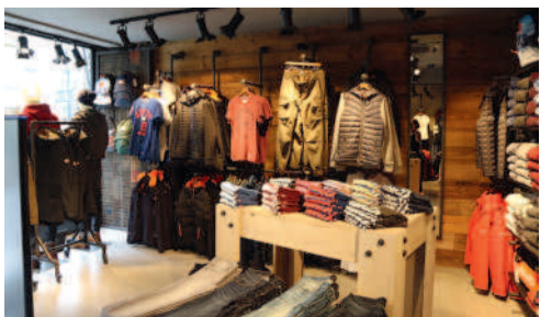
Superdry, vêtements hommes et femmes 8 rue des Trois Barbeaux