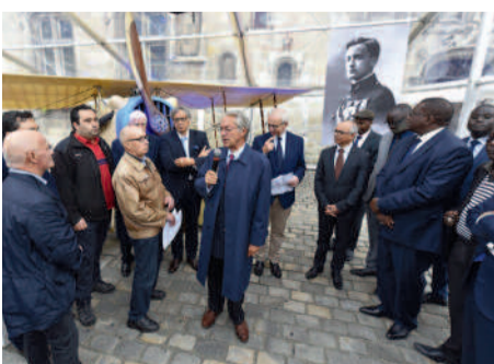
◀ Un SPAD 7 exposé place de l'Hôtel de Ville pour honorer la mémoire de l'aviateur compiégnois Georges Guynemer.

La Fête des associations, ▶ qui est aussi le rendez-vous de la rentrée, connaît toujours un vif succès.