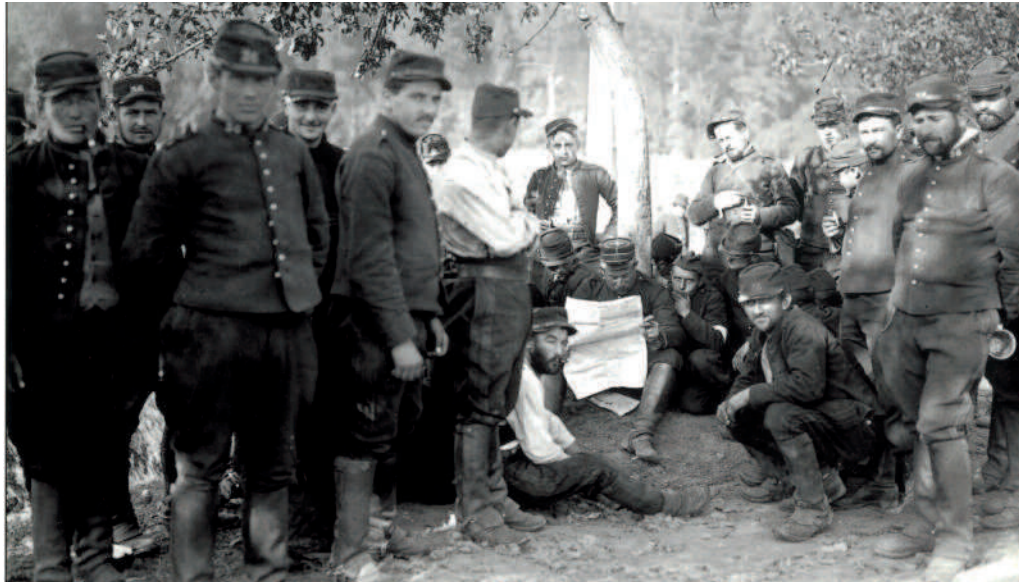
Dans l'Oise, artilleurs faisant la lecture des journaux sur le front de l'armée française