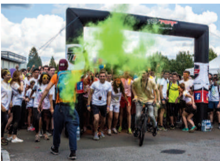
◀ S'ouvrir aux Compiègnais, c'est l'objectif de la course colorée de l'UTC qui a réuni plus de 1500 participants cette année.

De nouveaux défis ont été relevés ▶ par les étudiants lors de l'opération Tous Unis pour la Cité.