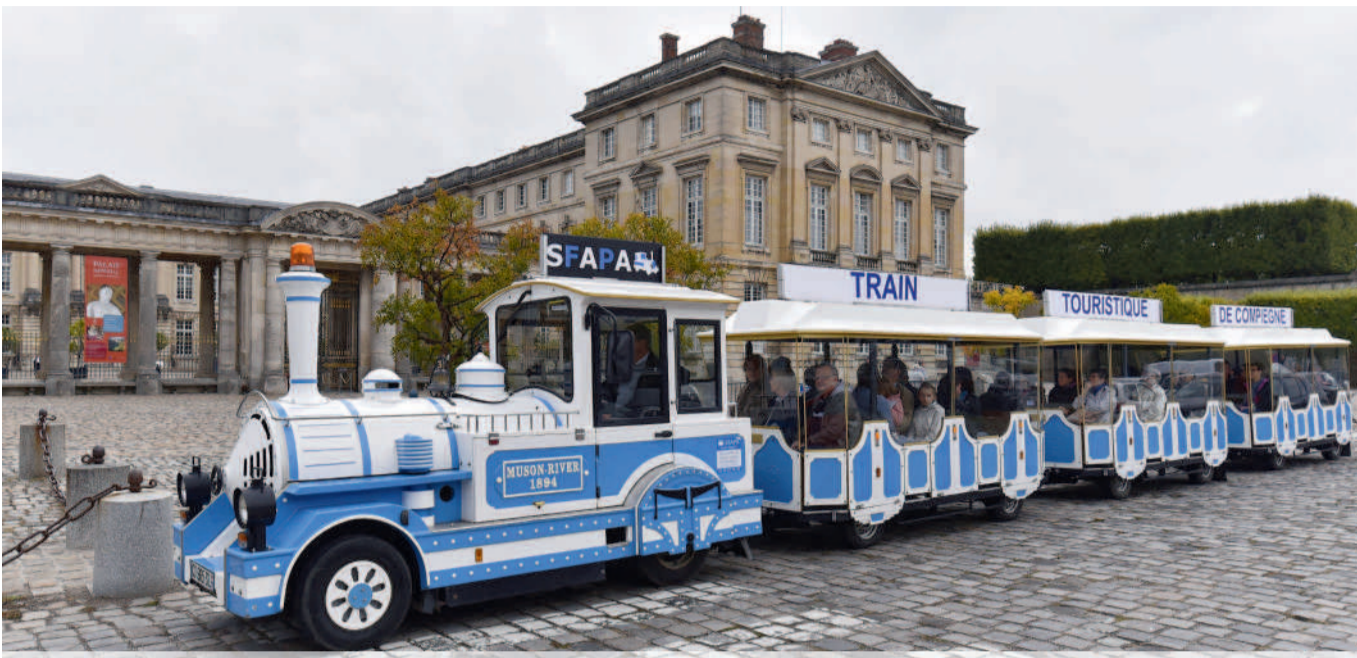
Les nouveaux Compiègnais visitent la ville à bord du nouveau train touristique qui sillonne désormais les rues de Compiègne.