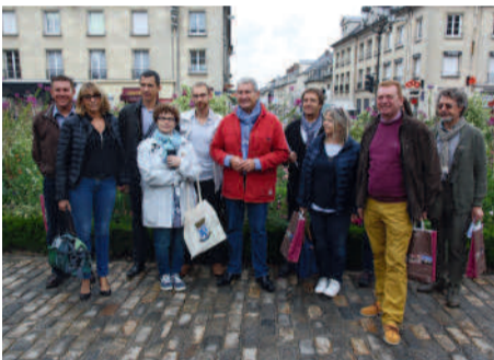
◀ Compiègne accueille le jury des Villes et Villages fleuris en vue de l'obtention de la 4 e fleur.

Compiègne, ville impériale, ▶ le temps d'un week-end.