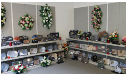
Les Pompes Funèbres B&C 10 rue du Général Leclerc