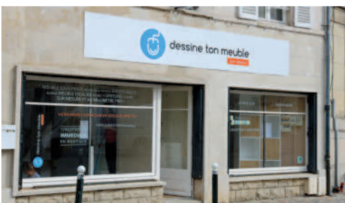
Dessine ton meuble sur mesure rue du Dahomey