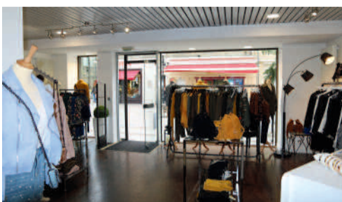
Mademoiselle, vêtements pour femmes 27 rue Saint-Nicolas