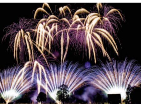
◀ Les Masters de feu ont embrasé le ciel compiégnois malgré la pluie. La Grèce est la grande gagnante de cette édition 2017.

Larache et Ziguinchor ▶ désormais liées à Compiègne par une charte de coopération.