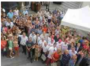
◀"Photo de famille" lors du rassemblement amical de fin de saison des commerçants du centre-ville.

Excellent cru 2015 ▶ 39 bacheliers compiégnois ayant obtenu la Mention Très Bien, ont reçu la médaille de la Ville.