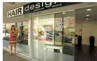
Hair Designer - Lydie Cordie procédera au changement total de la vitrine de son salon de coiffure début septembre pour un accès simplifié.