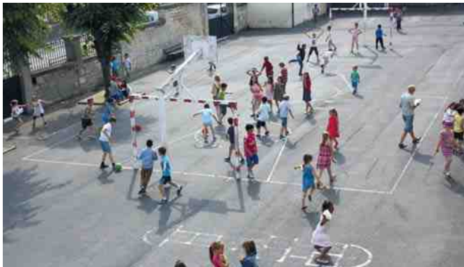
Dès le mois de novembre, les enfants de maternelle pourront bénéficier d'activités après la classe.