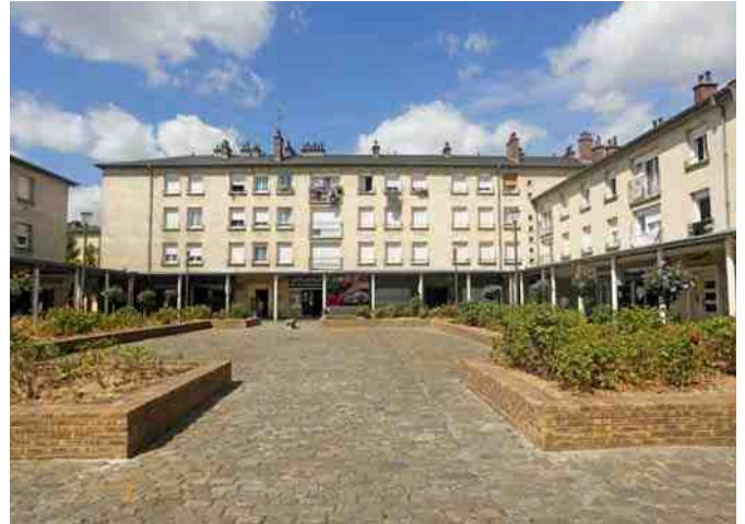
Le quartier de la Victoire va également bénéficier du renouvellement urbain proposé par le Contrat de Ville.

La politique de la ville a profondément été rénovée par le législateur. Aujourd'hui, les agglomérations doivent s'engager dans des programmes cohérents et surtout transversaux qui ont pour objectifs d'améliorer la cohésion sociale et la vie dans les quartiers.