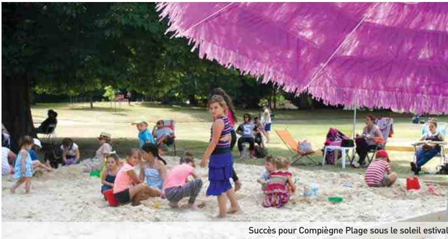
Succès pour Compiègne Plage sous le soleil estival.