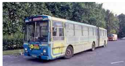
Les bus articulés sont mis en service à l'été 1976.

→ 1981 : 6 véhicules sont mis en service ; ils desservent