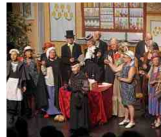
Réunis sous le titre de "Grande brasserie", des extraits de pièces de théâtre de boulevard et de "Palace" de Jean-Michel Ribes ont fourni matière à s'amuser, côté public et côté comédiens.

Samedi 5 septembre à 20h30, le Ziquodrome se transformera en Brasserie. Au menu de ce restaurant délirant, humour et détente garantis. Les clients et serveurs seront interprétés par les élèves de l'atelier théâtre des aînés. Un bon moment de rire et de plaisir offert par les acteurs de l'atelier théâtre mis en scène par Frédéric Morlot. Entrée gratuite.