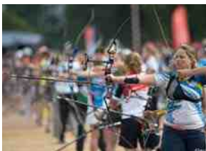
◀Championnat de France de tir à l'arc à Compiègne Les Compiégnoises ont pris une sérieuse option pour la victoire finale.

La fête des centres aérés ▶ avait pour thème la protection de la planète. De quoi permettre aux enfants de présenter danses et costumes.