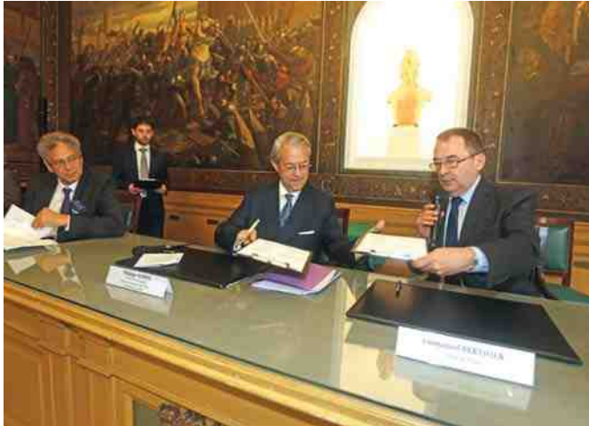
Signature du contrat de ville par les différents partenaires.