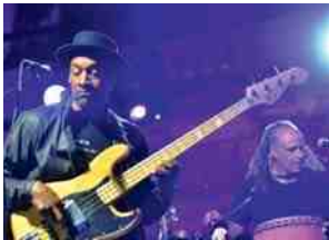
◀Palais en Jazz avec Marcus Miller, dans la cour d'honneur du Palais Impérial.

Le Festival des forêts a signé une nouvelle et belle édition ▶ Les concerts se sont succédé, faisant le plein d'un public conquis.