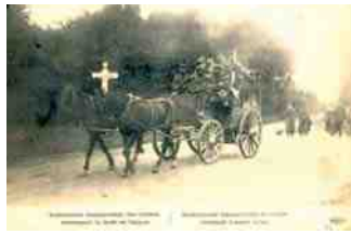
Ambulance transportant des blessés traversant la forêt de Laigue

Onzième épisode du journal d'Adrienne Deforges.