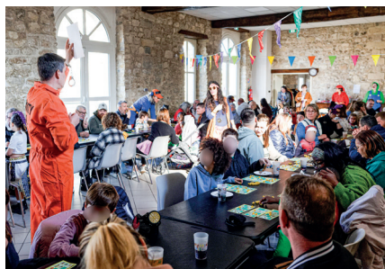
Le lotto-carnaval des enfants organisé par Nérygolotte, le 15 mars dernier, a rencontré un vif succès

bénévoles du village, l'association propose tout au long de l'année des animations qui rassemblent largement. Deux temps forts marqueront la saison : la kermesse de l'école le 20 juin et la fête du village le 5 septembre , un partenariat avec l'association Pathine et la mairie. Les fonds récoltés, complétés par la subvention municipale et les dons des entreprises locales, permettent de financer de nombreux achats pour améliorer le quotidien des enfants : livres, piscines, ballons, tapis, cadeaux de Noël... Joyeuse, active et fédératrice, Nérygolotte reste ouverte à toutes les bonnes volontés : elle a toujours besoin de bénévoles pour continuer à faire briller la vie du village et poursuivre ses actions au service des enfants.