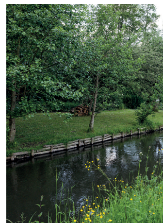
Aménagement de la zone humide de