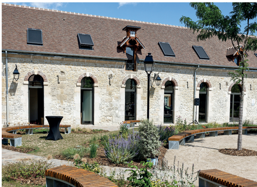
Réhabilitation de l'espace Balsan à La Croix Saint Ouen