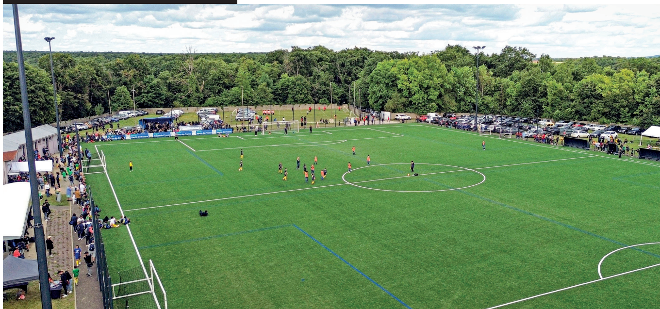
Le nouveau terrain de foot synthétique de Béthisy-Saint-Pierre