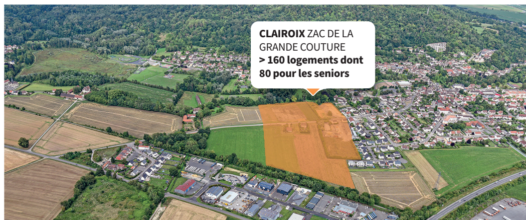
CLAIROIX ZAC DE LA GRANDE COUTURE > 160 logements dont 80 pour les seniors

À Verberie, la ZAC du Quartier des Moulins vise à transformer cet espace en un quartier à taille humaine, aujourd'hui