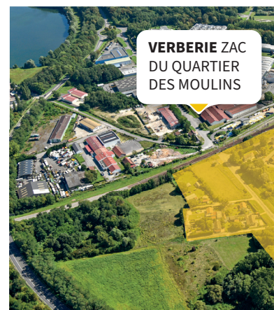
VERBERIE ZAC DU QUARTIER DES MOULINS