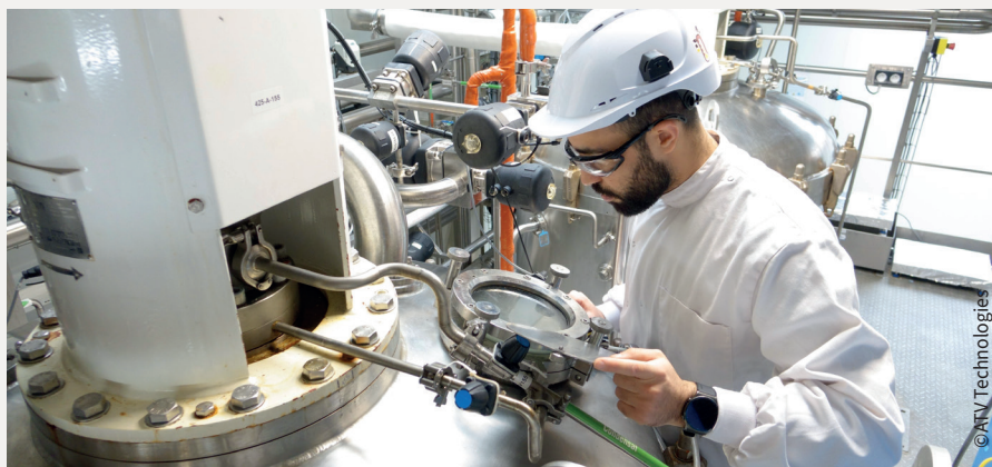
Activités de biotechnologies menées par ATV Technologies

Installé sur le Parc Technologique des Rives de l'Oise à Venette, le groupe Avril développe un écosystème dédié à la chimie verte et aux biotechnologies. En reprenant les activités de PIVERT en 2025, l'industriel renforce la dynamique d'innovation autour du végétal et confirme la place de l'agglomération compiégnnoise parmi les territoires de référence pour les solutions industrielles durables.