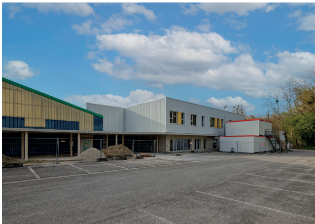
Réhabilitation du complexe sportif André Mahé à Choisy-au-Bac