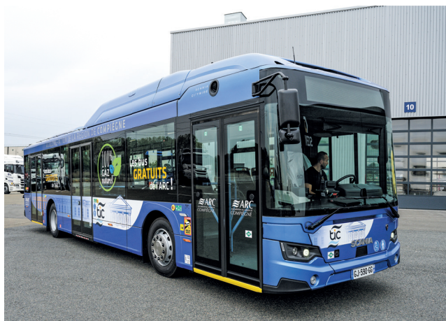
Les nouveaux bus au BioGNV